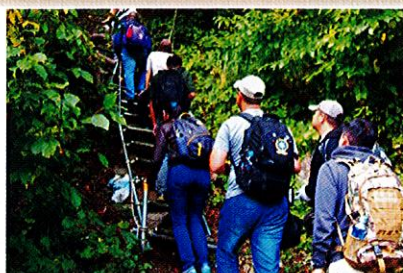
群馬県谷川岳エコツアー:山麓レッキングの様子