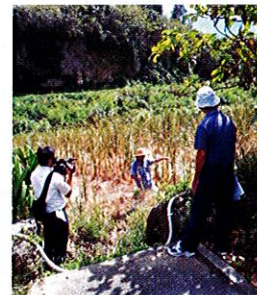
写真 3. 水中に茎や葉のあるタイワンアシカキが特に枯死