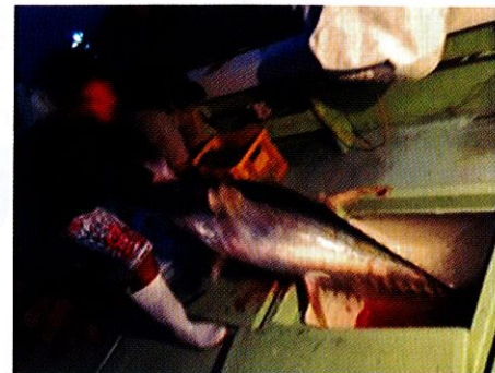
パヤオを利用した漁業実習(宮古島沖)

一方、大洋州諸国とカリブ諸国では、歴史的な背景が異なることから地域組織の形成や意思決定のプロセスにも大きな違いがあり、共同管理・運営という点については異なるアプローチや研修方法も検討する必要があることも分かってきました。このことは水産分野に限らず、他分野でも共通した課題と思われる。