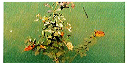
写真 4. 上部の葉だけが枯れたヒルギダマシ