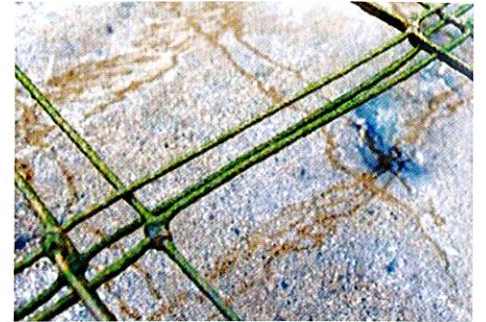
アーサの種付け中。潮の満ち引きにより、網にアーサが付きま

などと戦いながら、いかに愛情と手間をかけるかで良し悪しが決まるそうです。今年採れたアーサの加工品を1つ頂き家で食べ、そのおいしさに感動したのですが、1度冷凍すると味はどうしても落ちてしまうようで、採れたてのアーサはこの何倍もおいしいといえます。