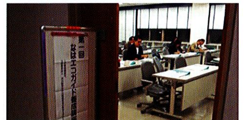
11月18日、開講式で始まりました。