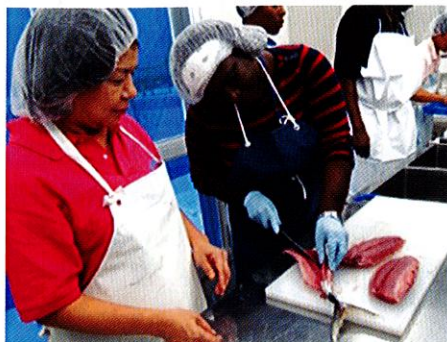
魚の捌き方の実習 (沖縄県水産海洋技術センター)

立てることができる。」「自組織では漁獲物の取り扱いや水産加工に関して高度な研修は行われておらず弱い分野である。このような研修は非常に役に立つ。」などのコメントが寄せられ、充実した研修だったことがうかがえました。※研修の様子はFacebookでも見ることができますのでご覧ください。