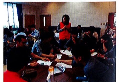
最後の意見交換会。学生を中心に活発な意見がでました