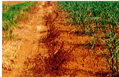
写真 1. 畑の畔に撒かれた除草剤

約25年前、久米島の海岸は赤土汚濁・堆積がひどい状態で、海草帯と思われる干潟が緑の無い丸ハゲ状態だったことを思い出します。多分、干潮時に降雨で陸域から赤土の濁りとともに、まだ効き目の残る除草剤が干潟に流れ込み、海草が枯死したためと推測しました。同じことが、宮古島川満マングローブのヒルギダマシでも見られました。雑草を抑えるため、畑の畔や農道沿いに除草剤が撒かれます(写真1)。