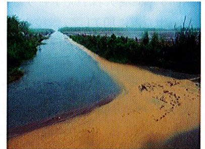
写真 2. 降雨時に畑から流れ出た濁水