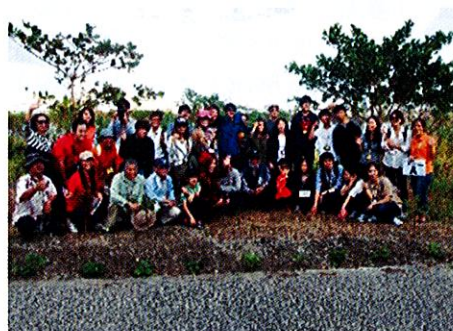
植樹後の記念撮影の様子