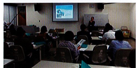
オリエンテーションの後に OEC プログラムの説明をしました