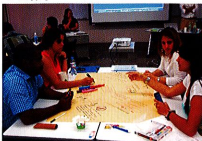
ファンリテーション講座:グループ別ワークショップの様子

的な取り組みがまだ十分には行われておらず、経験やノウハウの備蓄も不十分な状況にあります。このような状況を受け、2005～2009年に「全世界の国々」を対象としたエコツーリズムの経験・ノウハウの普及を目的とした研修を実施し、2010～2012年には対象地域を類似した自然環境、文化の地域ごとに絞り込み、「中南米地域」対象の「人材育成普及型」研修を実施しました。そして昨年2013年には「中南米地域」対象の「第1回:課題解決促進型」研修を実施し、引き続き今年は「第2回:課題解決促進型第2」の研修を行いました。