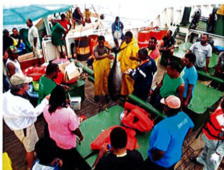
地元漁業者との操業・漁業実習 (カンダブ島ロマティ村沖) 漁獲後は船上で血抜き・保冷を実施

研修員から「研修を通して新たな漁業方法や食品加工手法を学んだ。多くの新しい学びがあり、コミュニティーの訓練に役