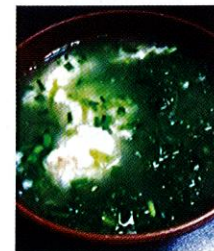
頂いたアーサは「ゆしどろふ」と一緒にお汁で。ご馳走様でした。