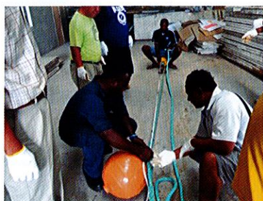
中層兼表層パヤオの製作実習 (フィジー水産局東部地区事務所)

立てることができる。」「自組織では漁獲物の取り扱いや水産加工に関して高度な研修は行われておらず弱い分野である。このような研修は非常に役に立つ。」などのコメントが寄せられ、充実した研修だったことがうかがえました。※研修の様子はFacebookでも見ることができますのでご覧ください。